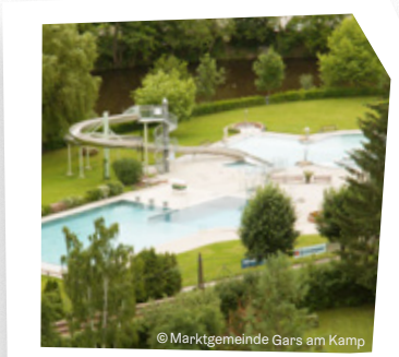
Erlebnisbad Gars am Kamp

Gars am Kamp bis Langenlois: 19 km geeignet für Kinder ab 10 Jahren